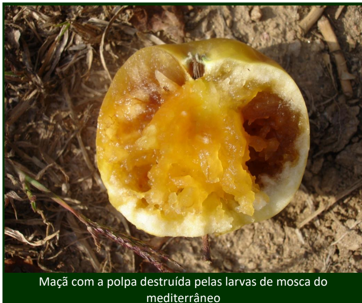
Maçã com a polpa destruída pelas larvas de mosca do mediterrâneo

Como medida cultural, algumas variedades podem ser colhidas mais cedo, procurando evitar que sejam atacadas.