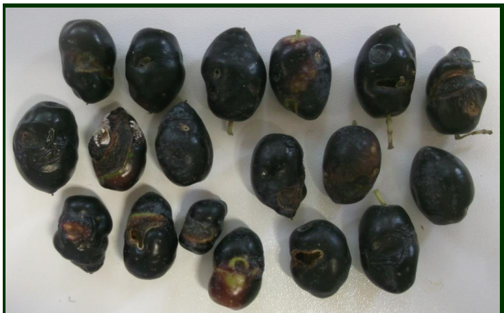
Azeitonas inutilizadas por larvas da mosca da azeitona (aspecto exterior)

Tempo seco e quente é desfavorável à atividade desta mosca. Abaixamento das temperaturas, humidade elevada, chuvadas de verão, são favoráveis.