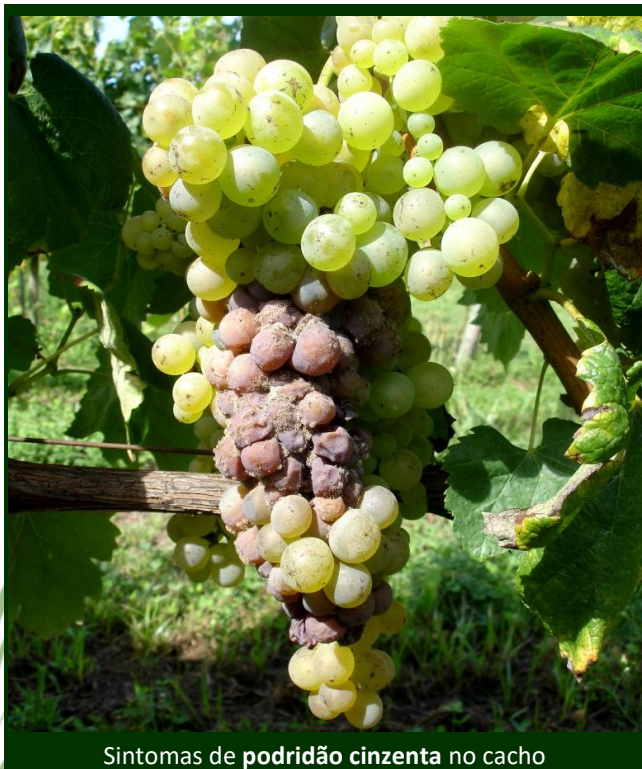
Sintomas de podridão cinzenta no cacho

Por outro lado, o estado de maturação da maioria das castas regista um avanço de cerca de duas semanas relativamente à média dos últimos anos.