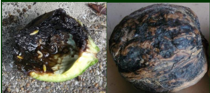
↶ Larvas da mosca no interior da casca verde enegrecida e semi-desfeita e ↷ noz manchada e desvalorizada em consequência da ação das larvas