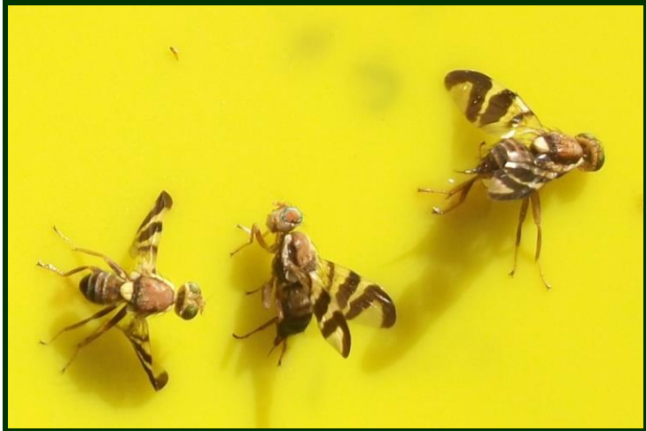
Moscas da casca verde (imagem muito ampliada)