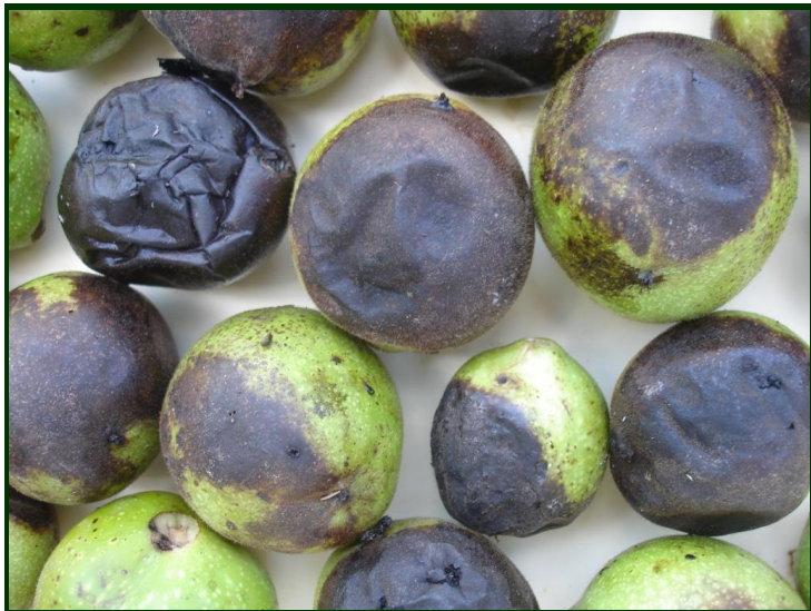
Aspeto exterior das nozes atacadas pela mosca da casca verde