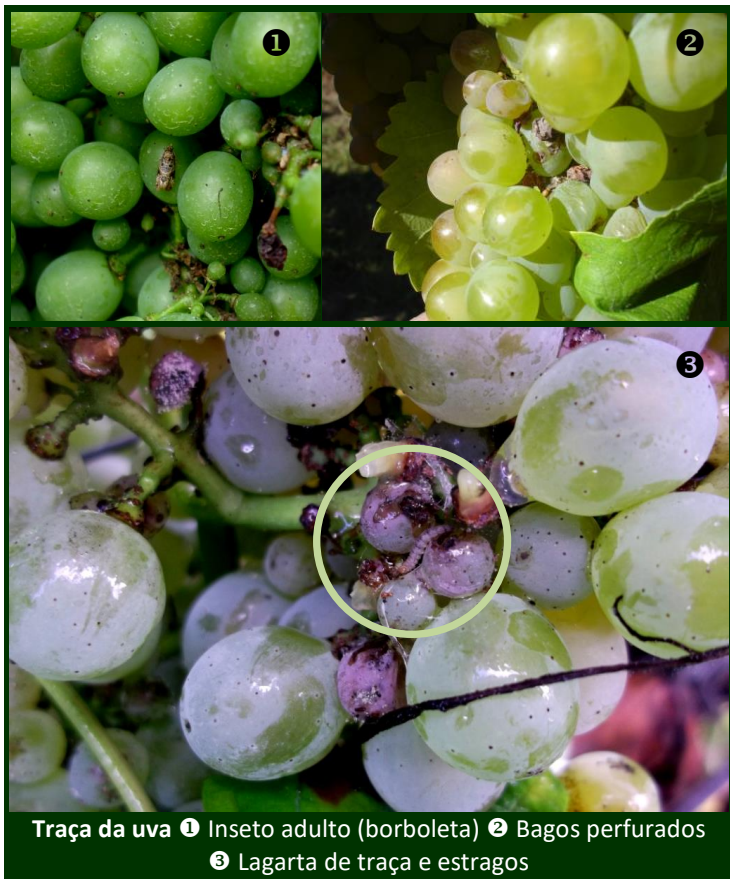
Traça da uva 1 Inseto adulto (borboleta) 2 Bagos perfurados 3 Lagarta de traça e estragos

No Modo de Produção Biológico , podem ser utilizados inseticidas anti-traça à base de azadiractina (ALIGN, FORTUNE AZA), Bacillus thuringiensis (TUREX, PRESA, SEQURA) e spinosade (SPINTOR, SUCCESS).