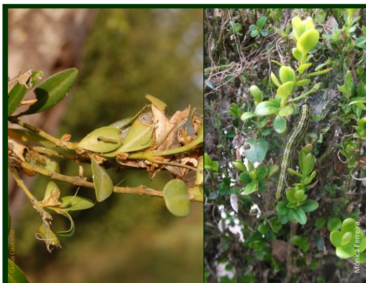
◀ Larva jovem (L 1 -L 2 ) • Larva no estado final (L 5 ) (4 – 5 cm) ➤ (imagens em dimensões próximas do natural)

Em Portugal não estão homologados fungicidas para o combate ao míldio do buxo. No entanto, ensaios realizados em diversos países com fungicidas à base de clortalonil , difenoconazol , epoxiconazol , procloraz , boscalide+piraclostrobina e cresoxime-metilo , apresentam resultados satisfatórios no combate a esta doença.