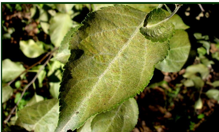
Sintomas de araniço vermelho em folhas de macieira

Consulte a Ficha Técnica nº 37 (II Série/ DRAPN)