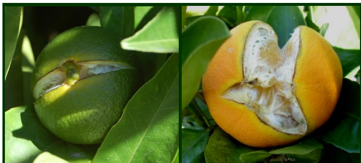
Rachamento dos frutos, ainda verde e em maturação

(CUMQUATE, LARANJEIRA, LIMEIRA, LIMOEIRO, TORANGEIRA, TANGERINEIRA)