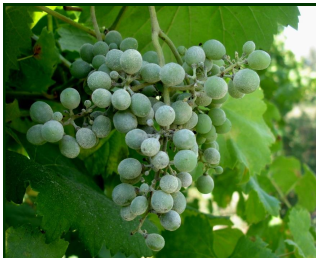
Oídio ( pó branco ) nos bagos na proximidade do fecho do cacho

Consulte a Ficha Técnica nº 110 (I Série/DRAEDM) e a Ficha Técnica nº 8 (II Série/ DRAPN)