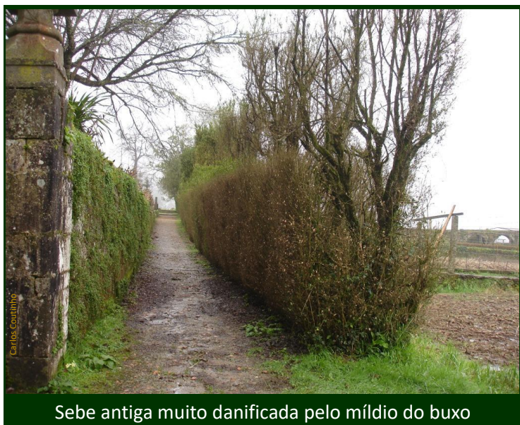
Sebe antiga muito danificada pelo míldio do buxo

Durante o verão , recomenda-se: ► regar pelo pé , sem molhar a folhagem ► remover as folhas caídas e a parte superficial do solo na proximidade de plantas doentes ► arrancar e queimar as plantas mortas ► cortar e queimar os ramos doentes ► desinfetar com lixívia os instrumentos de corte utilizados.