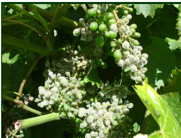
Míldio esporulado (rot-gris) em cachos no estado grão de chumbo

Temos observado pequenos focos de míldio esporulado (rot-gris) em alguns locais (Vila Nova de Cerveira, Celorico de Basto, Castelo de Paiva, etc.).