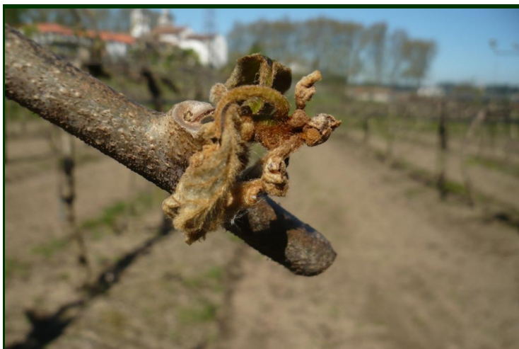
Raminho abortado, no início da rebentação, em planta infetada por PSA

Nos períodos de chuva, as bactérias dispersam-se pelo pomar e para fora dele, infetando as plantas sãs e reinfectando as que já estiverem doentes.