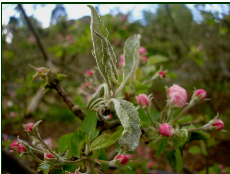
Raminho com oídio durante a floração

Nas variedades sensíveis, deve ser feito um tratamento contra o oídio, sobretudo se observar sintomas. Pode utilizar o enxofre, que também combate o pedrado, ou um outro fungicida anti-pedrado que combata em simultâneo oídio.