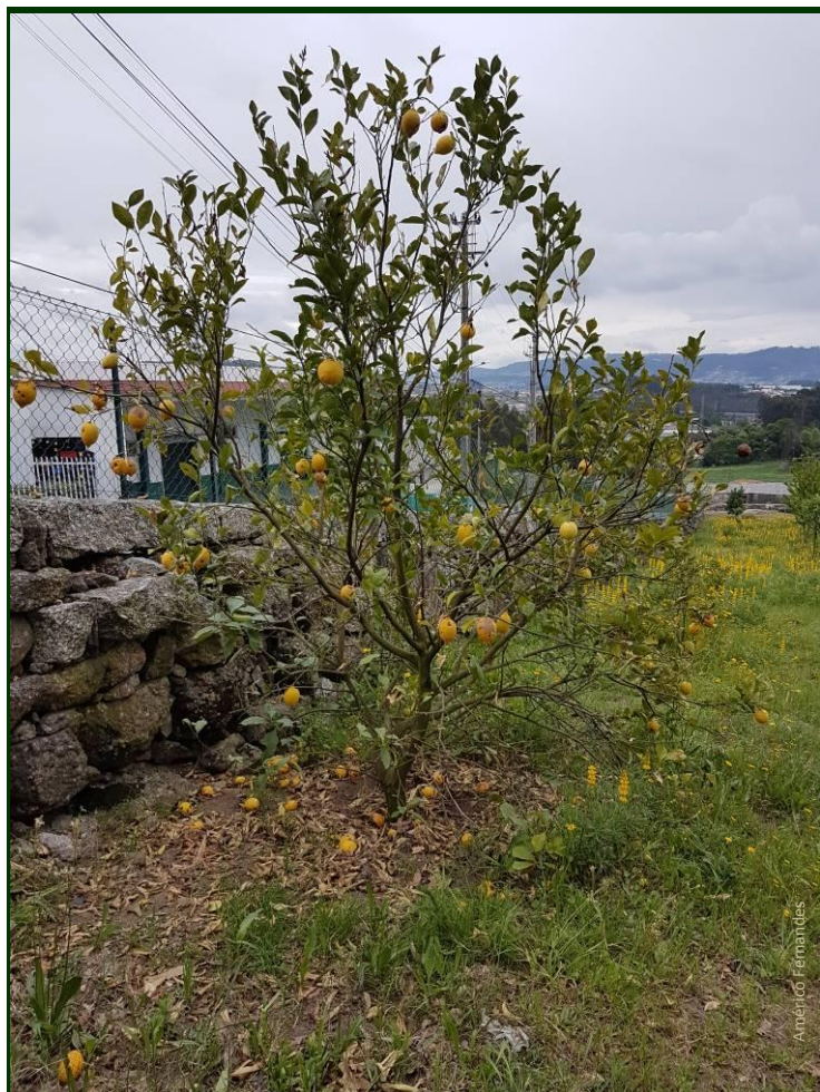
Limoeiro atingido pelo míldio intensamente desfolhado