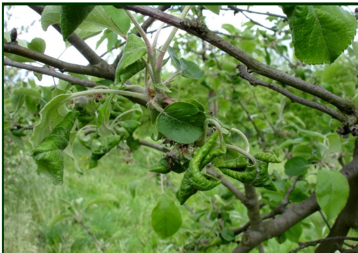
Enrolamento de folhas causado pelo ataque de piolho cinzento

Para combate ao oídio da macieira no Modo de Produção Biológico , são autorizados produtos à base de enxofre .