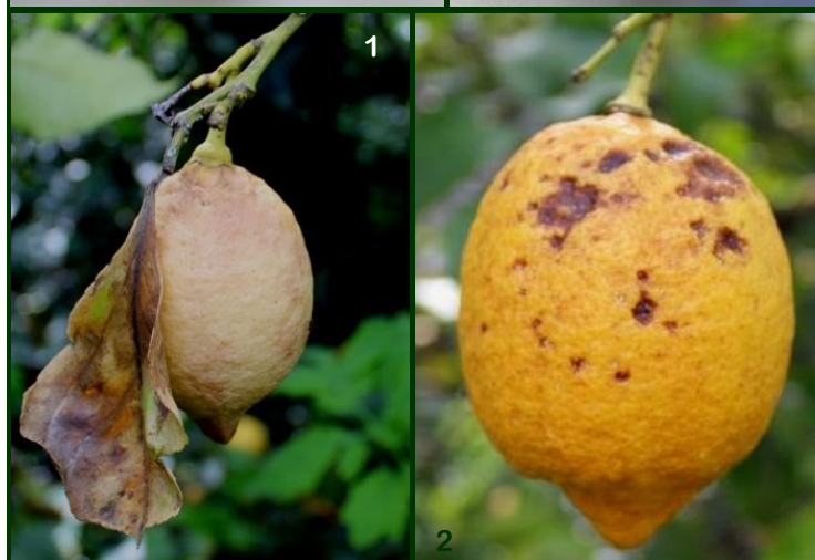
Sintomas de míldio (1) e de antracnose (2) em limões