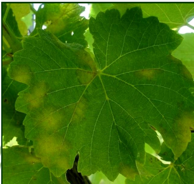
Sintomas de míldio (mancha de óleo) em folha nova

Por outro lado, temos observado a maturação lenta e em pequena quantidade dos oósporos do míldio, o que pode ser explicado pelas baixas temperaturas que se registaram durante todo o mês de março e na maioria dos dias de abril e que persistem ainda.