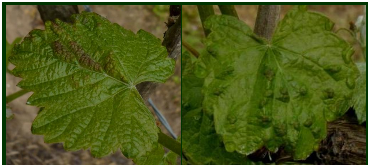
Sintomas de erinose, no cedo, em folhas muito jovens